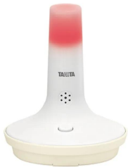
画像は、熱中症の危険を知らせる光が点灯したイメージです。