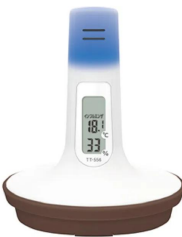
本体背面と季節性インフルエンザの危険を知らせる光が点灯したイメージです。