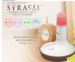
画像は、商品機能のイメージです。