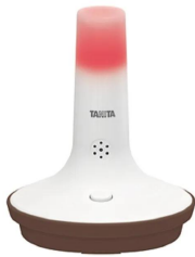
画像は、熱中症の危険を知らせる光が点灯したイメージです。