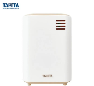
画像は、子機正面のイメージです。