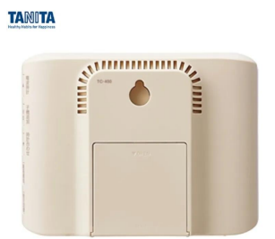
画像は、親機背面のイメージです。