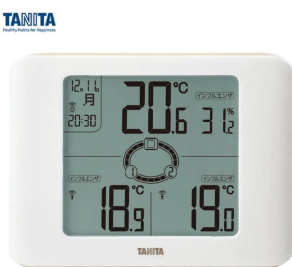
画像は、親機正面のイメージです。