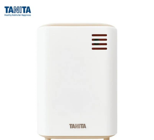
画像は、子機正面のイメージです。