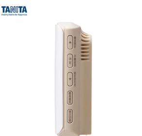
画像は、親機側面のイメージです。