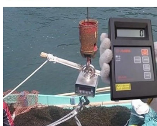
画像は、リモコンの使用イメージです。