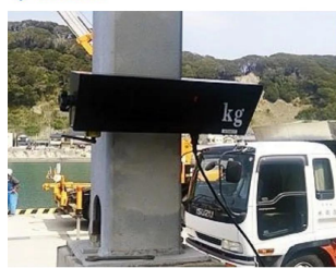
画像は、オプションにある大型表示のイメージです。