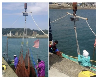
画像は、岸壁・船上での使用イメージです。