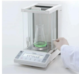
画像は、商品の使用イメージです。