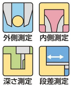
外側測定 内側測定