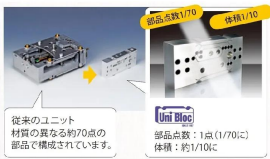
従来のユニット 材質の異なる約70点の 部品で構成されています。