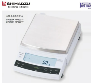
SHIMADZU Excellence in Science