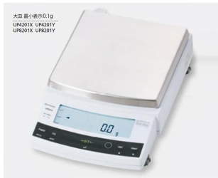
大皿 最小表示0.1g UP8201X UP4201Y UR8201X UR4201Y