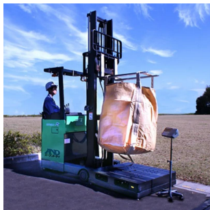
写真は、計量作業のイメージです。