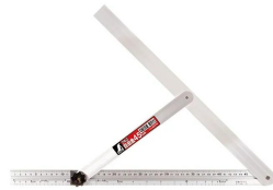
シノワ 測定株式会社 画像は、商品イメージです。