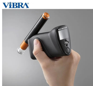
画像は、商品を手に持ったイメージです。