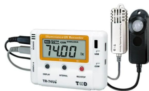
画像は、商品イメージです。