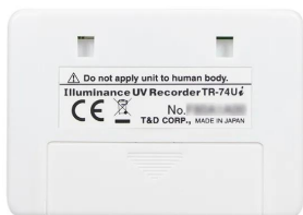
画像は、商品背面のイメージです。