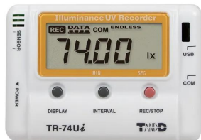
写真は、表示部のイメージです。