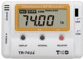
写真は、表示部のイメージです。