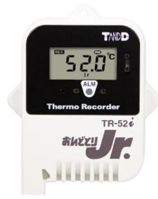
写真は、表示部のイメージです。