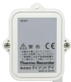
画像は、商品背面のイメージです。