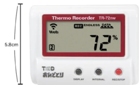
画像は、商品の大きさのイメージです。