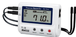
画像は、商品イメージです。