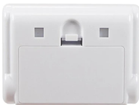
画像は、商品背面のイメージです。