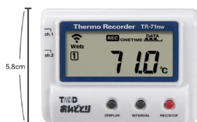
画像は、商品の大きさのイメージです。