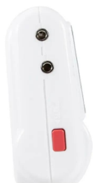
画像は、商品右側面のイメージです。