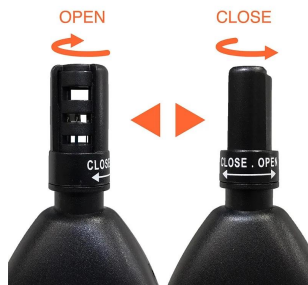
画像は、保護カバーのイメージです。