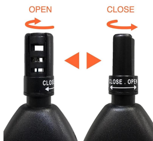
画像は、保護カバーのイメージです。