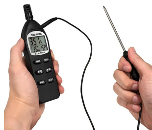
画像は、使用イメージです。