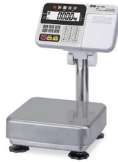
写真は、イメージ画像です。