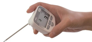
画像は、手で持った時のイメージです。