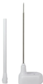
画像は、シースホルダのイメージです。