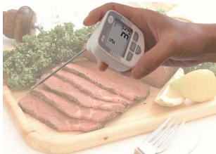
画像は、使用イメージです。