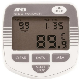
画像は、表示のイメージです。