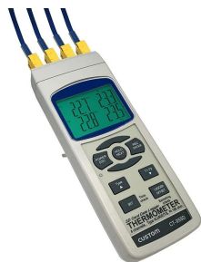
※接続ケーブルは別売です。