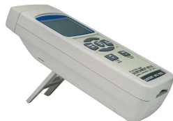
画像は、卓上スタンドのイメージです。