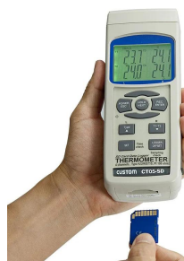
※SDカードは別売です。