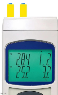
※接続ケーブルは別売です。