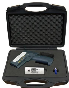
保管、持ち運びに便利な保護ケース付です。