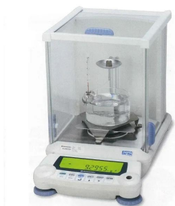
画像は、商品イメージです。表示のバックライト機能は、ありません。