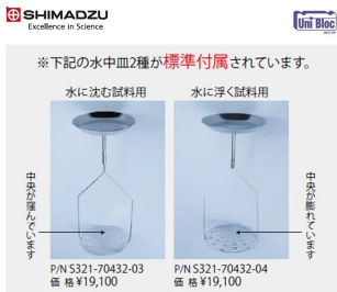
画像は、標準で付属している水中皿のイメージです。