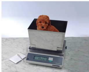
株式会社 島津製作所