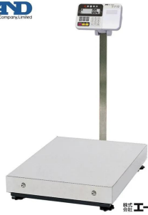
株式会社エー・アンド・デイ