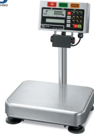
写真はシリーズ代表画像です。