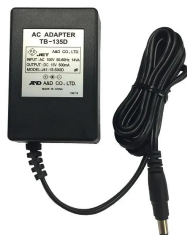
株式会社エー・アンド・デイ