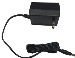
株式会社エー・アンド・デイ