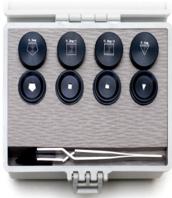
画像はセット用樹脂製ケースです