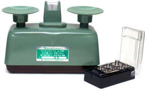
シリーズ代表画像です。