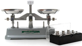
シリーズ代表画像です。