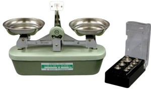
シリーズ代表画像です。