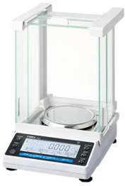
シリーズ代表画像