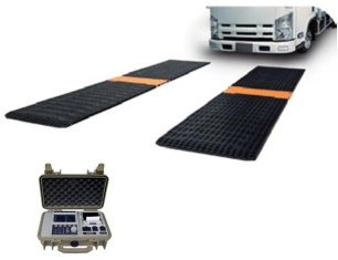
画像は、商品イメージです。トラックは、商品に含まれません。