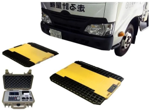
画像は、商品イメージです。トラックは、商品に含まれません。