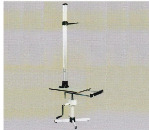
画像は、商品全体のイメージです。Y S 4 0 1-H 有限会社 吉田製作所