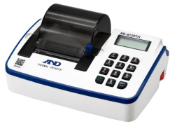
AD-8129TH サーマルプリンタ