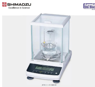
株式会社 島津製作所 分析計事業部