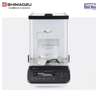
株式会社 島津製作所 画像は、ロゴマークなどの付いた商品イメージです。