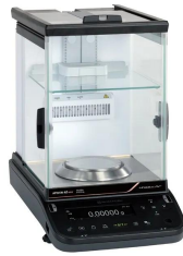
株式会社 島津製作所 画像は、ロゴマークなどの付いた商品 イメージです。