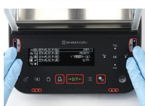
株式会社 島津製作所 画像は、タッチレスセンサの使用イ メージです。