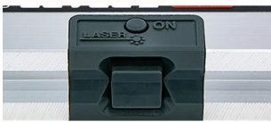
接触センサー (底部)