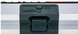
接触センサー (底部)