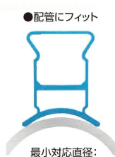
画像は、測定基準面がカーブしているイメージです。