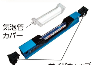
画像は、外せる気泡管保護カバーと側面キャップのイメージです。