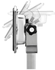
表示部は上方向に角度を調整可能(無段階)