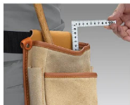
画像は、コンパクト収納のイメージです。