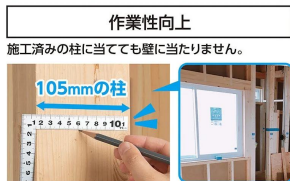
画像は、商品の使用イメージです。