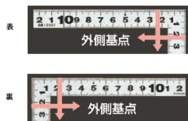
画像は、目盛のイメージです。