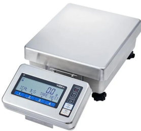
表示部一体用金具(オプション)で取り付けられた場合 写真は、表示部一体用金具(オプション)で取り付けられた場合の画像です。