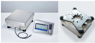
清掃性と組込み性を重視した筐体設計 ・筐体の凹凸を極力排除し、IP65規格のステンレス製筐体を採用することで、高い清掃性を実現しました。 ・表示部と計量部をコネクタ接続とすることで、ケーブル配線や設置組み込みの自由度を従来機から大幅に向上させました。