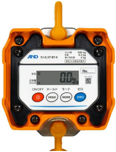
画像は、本体表示部のイメージです。