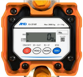
画像は、本体表示部のイメージです。