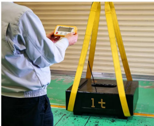
株式会社 エー・アンド・デイ 画像は、外部表示機での作業イメージです。