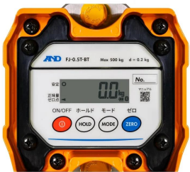
株式会社 エー・アンド・デイ 画像は、本体表示部のイメージです。 ：FJ-0.5T-BT