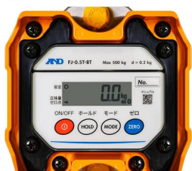
株式会社 エー・アンド・デイ 画像は、本体表示部のイメージです。