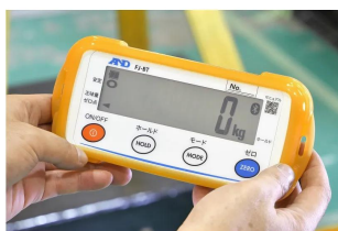
株式会社 エー・アンド・デイ 画像は、外部表示機の手持ちイメージです。