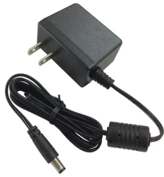
株式会社エー・アンド・デイ