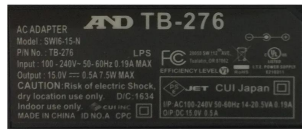
株式会社エー・アンド・デイ