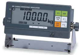
守随本店 SHUJI SCALES CO., LTD.