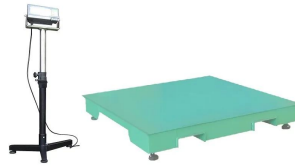
※表示スタンドはオプションです。